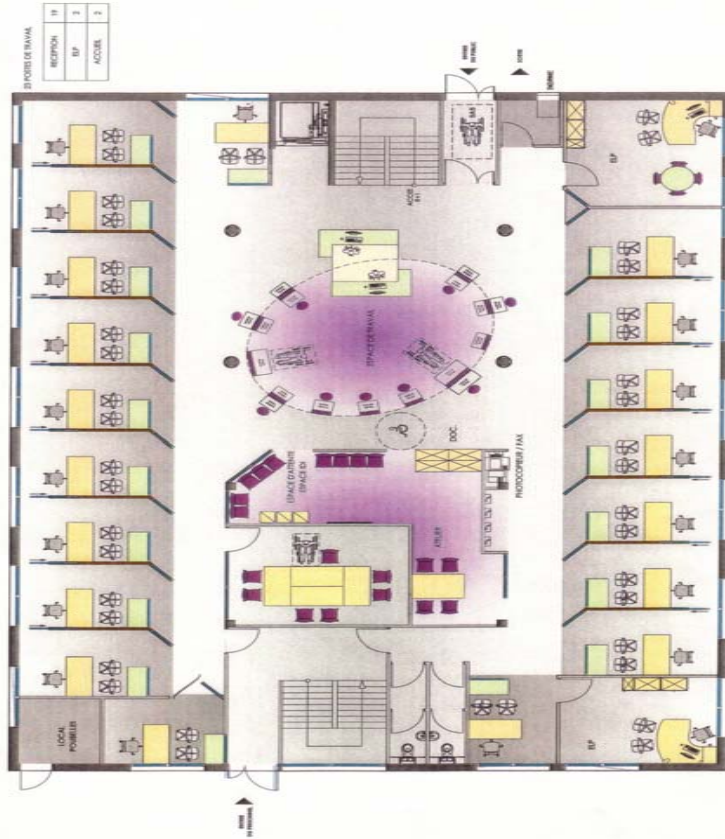
Rez de chaussée 19 clapiers (2,6 m X 3,00 m )